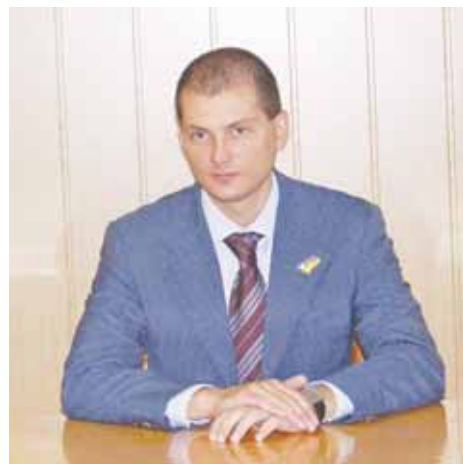
■ Денис Сергеевич Омелянович